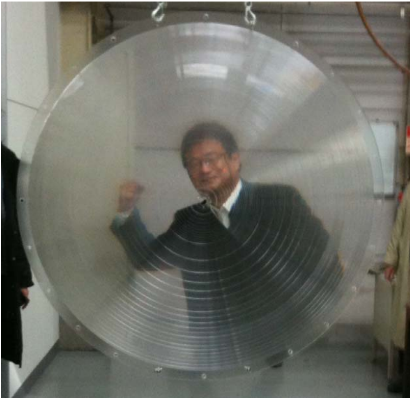
完成した両面フレネル曲面レンズの試作品（口径 1.5m）