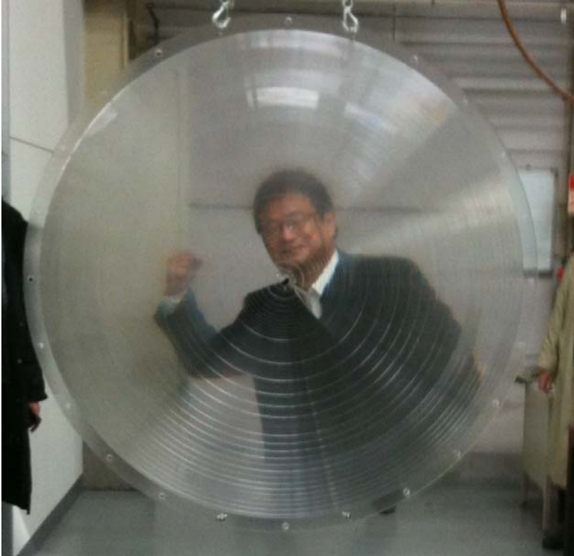
Experimental Fresnel lens with diameter of 1.5m